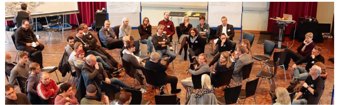
Die Zukunftsbotschafter trafen sich acht Mal in der Neuen Schmiede.

das jedoch anders. Neue Technologien, wie die vernetzte Küche, die intelligente Brille oder der virtuelle Assistent auf dem Computerbildschirm, machen autonomes Leben auch fern der Städte möglich. Die Wohnung der Zukunft ist überall für jeden Unterstützungsbedarf maßgeschneidert.